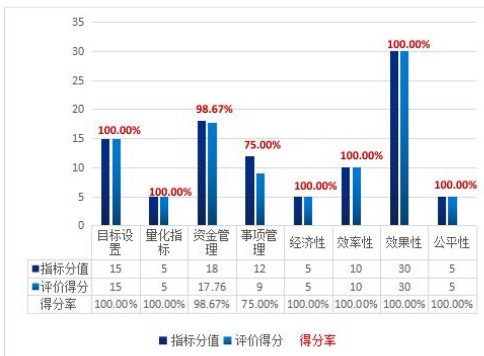
图 2 二级指标得分情况

项目综合评定平均得分率较高的方面集中在“效果性”、“效率性”、“目标设置”等指标，“资金管理”“事项管理”平均得分率略低。这些数据基本反映了 2017 年度“教学科研专项资金”项目的实施现状。